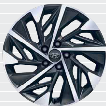
Amplia® Jantes en alliage léger 18" 235/55 R18