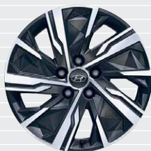
Origo® Jantes en alliage léger 17" 215/65 R17