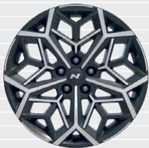
N Line Jantes en alliage léger 19" 235/50 R19