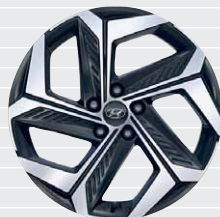
Vertex®/Amplia® HEV/PHEV Jantes en alliage léger 19" 235/50 R19